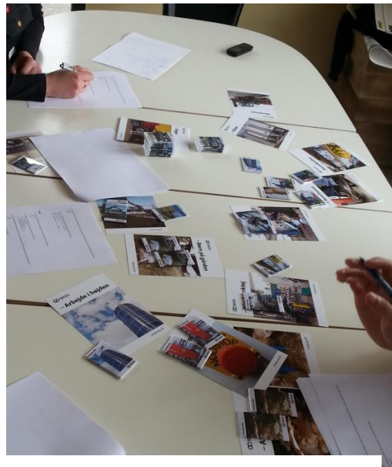
Udfyldelse af spørgeskema

Magneter er desuden præsenteret på kvæggkongres, dyrskuer, landbrugsskoler og til DLBR rådgiverne