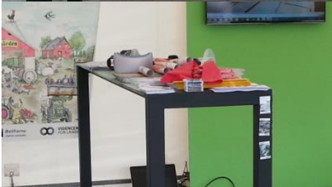
Fremvisning af magneter på Landsskuet i Herning