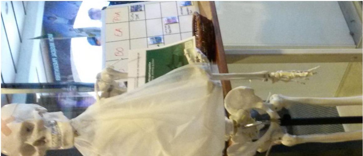
Magneter på tavle på kvægekongres 2015