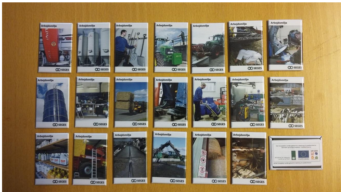
De 20 magneter til tavlemøderne

Der er lavet 20 forskellige magneter. De illustrerer i billeder fokusområder omkring arbejdsmiljø i forbindelse med de daglige arbejdsopgaver på bedriften.