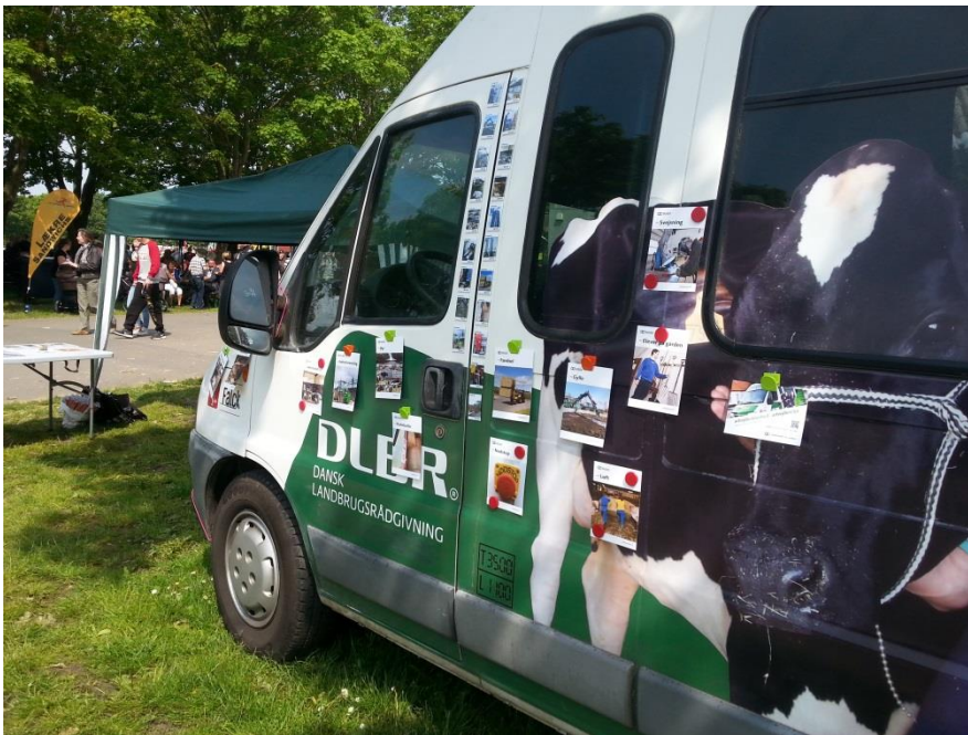
Fremvisning af magneter på Roskilde Dyrskue