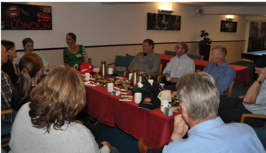
Introduktion af magneter til DLBR konsulenter